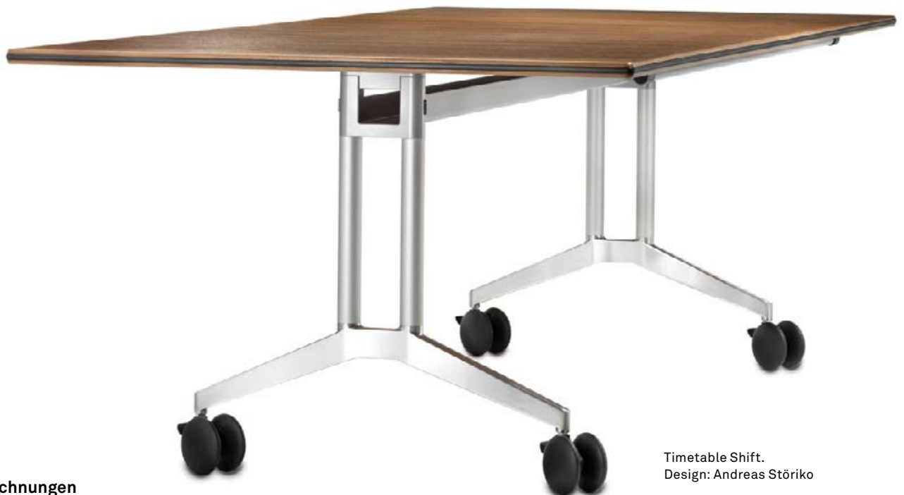
Timetable Shift. Design: Andreas Störiko

Mehr noch: Timetable Shift bietet ganz neue Möglichkeiten, teilbare Konferenzräume in der kostengüns-tigen Kombination aus mobilen Einzeltischen und statischen Logon-Tischelementen einzurichten.