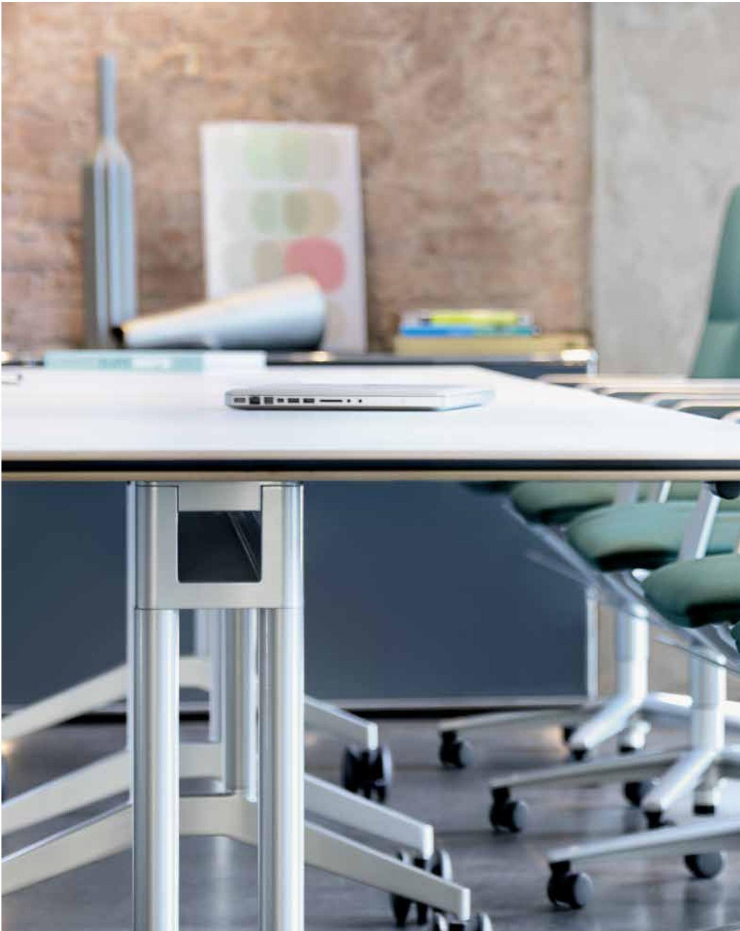
Sola se adapta a conceptos de diseño personalizados gracias a su amplia gama de acabados de armazón y opciones de tapizado disponibles.