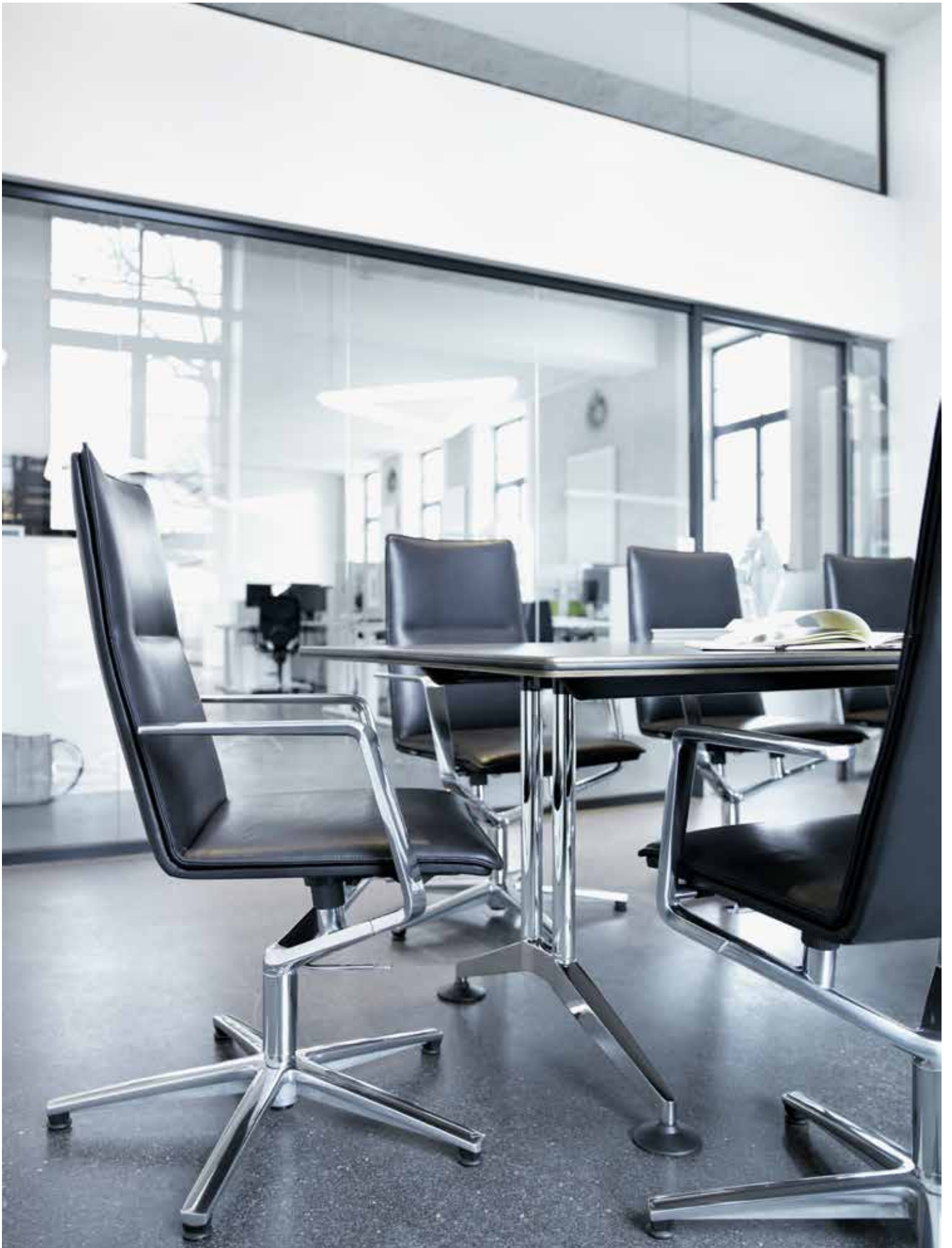
Tapizado en piel y armazón de aluminio pulido brillante, Sola es el ejemplo perfecto de conferencia al más alto nivel. Aquí, a juego, con la mesa Logon.