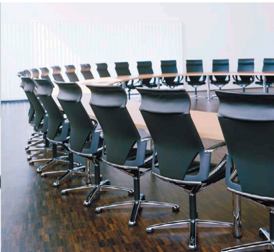
Modèle Modus Medium 281/5, dossier habillé de résille élastique opaque.