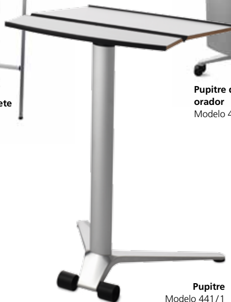
Pupitre Modelo 441/1