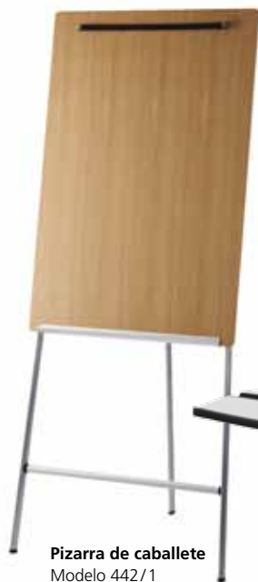
Pizarra de caballete Modelo 442/1