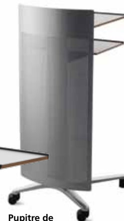
Pupitre de conférencier Modèle 448/9