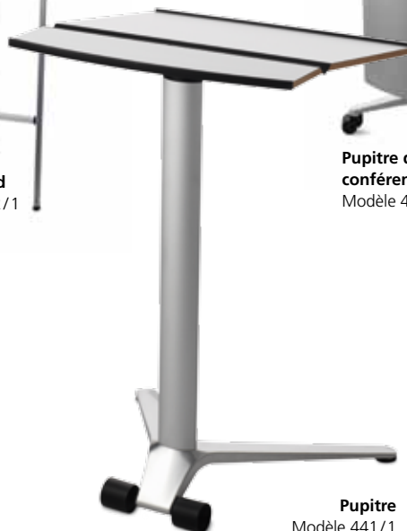
Pupitre Modèle 441/1