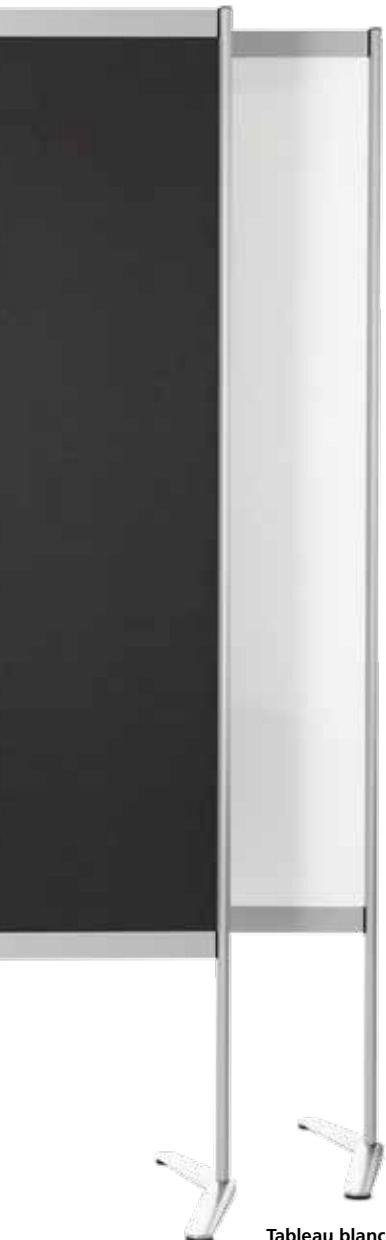
Tableau d'affichage Modèle 443/1

La gamme Confair incarne à merveille le mariage de l'innovation et de l'image : le soin apporté au détail, la noblesse des matériaux et un design inimitable sont tout autant source de cohésion et d'émulation que de reconnaissance. Lignes fines, mobilité et fonctions innovantes favorisent l'interaction et l'autonomie – et permettent par ailleurs de réduire les surfaces et les coûts. Il n'est donc pas étonnant que Confair soit devenue la référence internationale et l'icône d'une nouvelle manière d'aménager les espaces : un ensemble de solutions au design d'excellence pour concevoir des salles de conférence, de séminaire, des espaces-projet ou des ateliers.