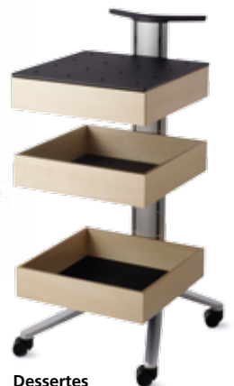
Dessertes Modèle 446/3